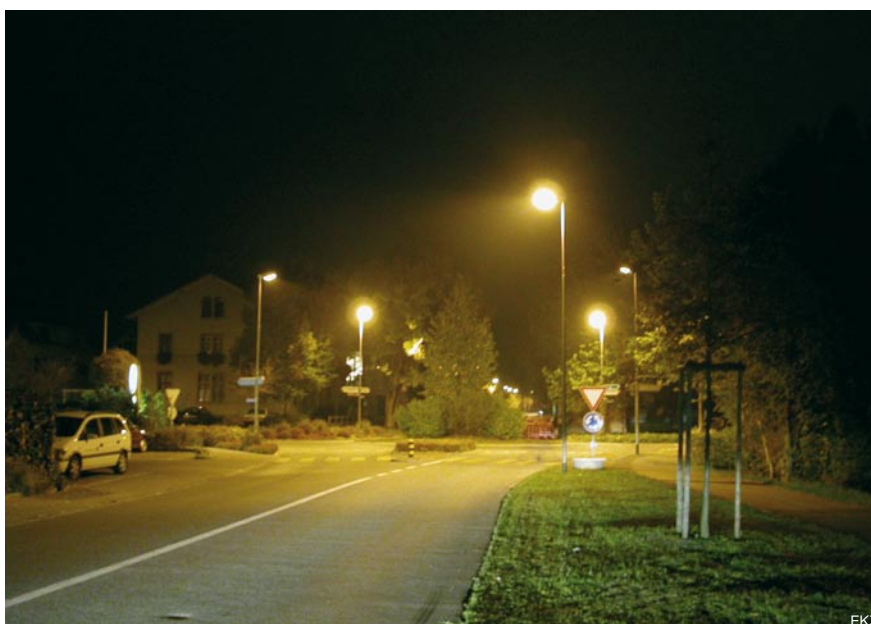
Bild 3 Beleuchtung eines Verkehrskreuzes mit Fussgängerstreifen

Datenerstaufnahme oder elektrische Sicherheitskontrolle: Für jede Beleuchtungsanlage ist mindestens einmal pro Anlage eine Datenerstaufnahme zu machen. Ist eine Abnahmekontrolle