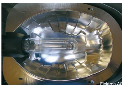
Bild 4 Innenansicht von Leuchten für die öffentliche Beleuchtung: links eine alte, rechts eine neue Leuchte