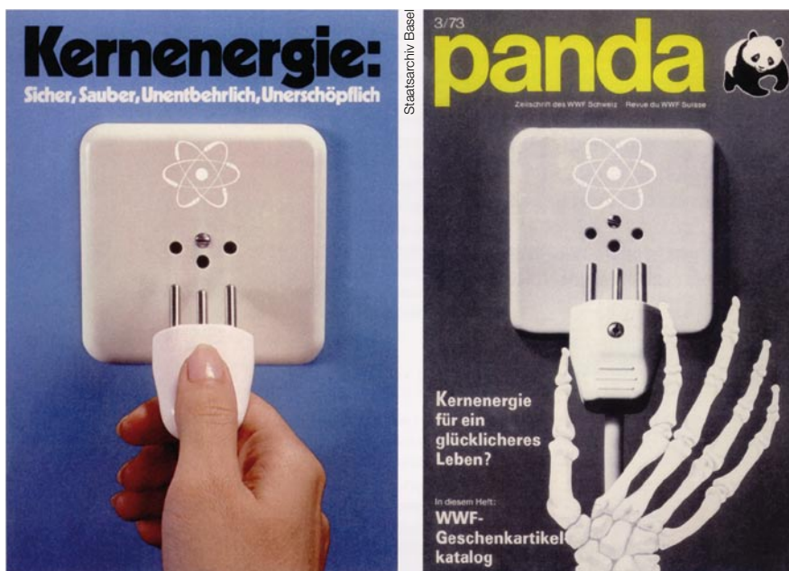
Bild 3 Die von der Elektrizitätswirtschaft 1973 herausgegebene Broschüre zur Kernenergie wurde vom WWF grafisch karikiert: Das Expertenwissen galt seit den späten 1960er-Jahren nicht mehr als unangreifbar.

werden von einer Reihe von Faktoren beeinflusst. Eine Stichwortsuche über alle in den Schweizer Medien behandelten Issues von 1998 bis 2008 hat ergeben, dass über Energieprodukte und -träger, u.a. die Atomkraft, zwar vor allem im Rahmen der nationalen Energiepolitik debattiert wird, dass aber auch andere Issues die Reputation der jeweiligen Energieprodukte beeinflussen können: Darunter befinden sich die Wahlkämpfe im In- und Ausland, der Irakkrieg, die atomare Aufrüstung Nordkoreas und des Iran sowie unvorhergesehene Ereignisse wie ein Hitzesommer, der die Flusskraftwerke lahm legt, oder grosse Kälteperioden, die den Energiebedarf sprunghaft in die Höhe schnellen lassen.