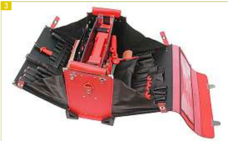
Beispiel für ein komplettes AuS-Werkzeug.

lich. Beispiele für AuS2: NH-Leisten unter Spannung ein-/ausbauen, Kabelendverschlüsse unter Spannung anbringen, Kabel einschlaufen, LS auswechseln usw.