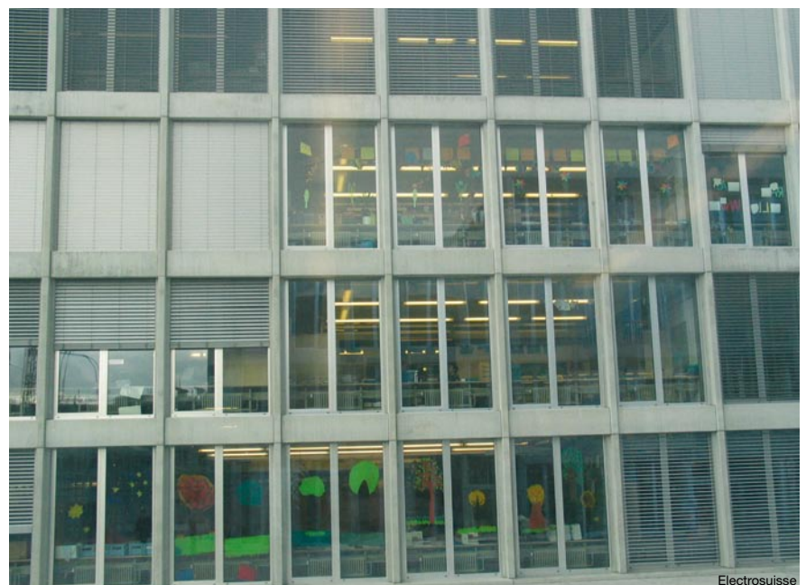
Bild 1 Schulhaus Birch: Auch bei diffusem Tageslicht sind 500 Lux schnell erreicht – die Beleuchtungsreihe am Fenster schaltet dementsprechend früh aus.

Die Fachstelle für Energie und Gebäudetechnik des Hochbauamtes der Stadt Zürich wollte sich auf Anfrage des Bulletins SEV/VSE zum Schulhaus Birch nicht äussern, wird in Zukunft aber auf