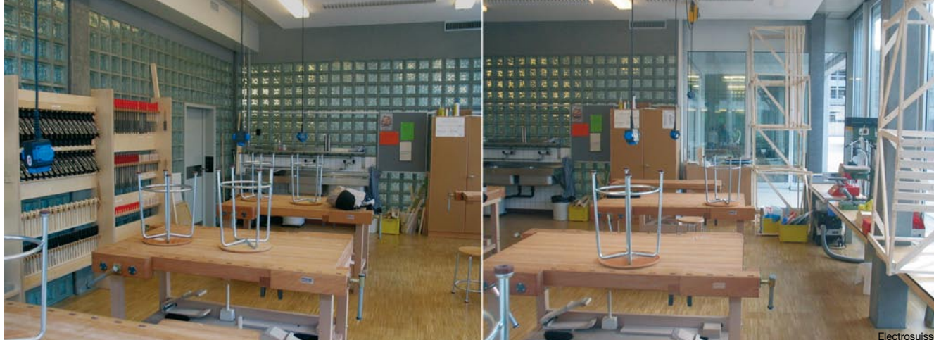
Bild 2 Tageslicht (rechts) und künstliches Licht (links) wirken anders auf den Benutzer. Zudem muss der Schattenwurf beim Tageslicht beachtet werden – zum Beispiel bei Arbeiten mit dem Rücken zum Fenster.

Hauser ist es wichtig, dass der Mensch entscheiden kann, wann er Licht will und wie viel. Das System soll ihn nur überwachen, also zum Beispiel das Licht ausschalten, wenn er nicht anwesend ist. Denn ganz ohne Steuerung gehe es nicht, wenn das Gebäude den Minergie-Standard SIA 380/4 einhalten soll. Wenn die Beleuchtung aber automatisch auf einen bestimmten Wert geregelt werde, seien die Nutzer, etwa Ärzte in Spitälern, häufig unzufrieden.